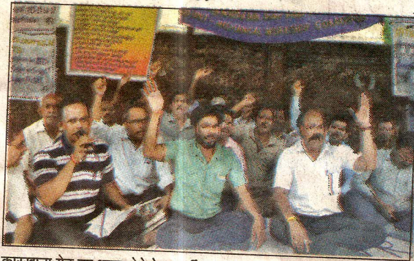
कारखाना गेट पर धरना देते रेल कर्मी।

कारखाना के मुख्य गेट पर रेल प्रशासन के विरुद्ध लगाए नारे