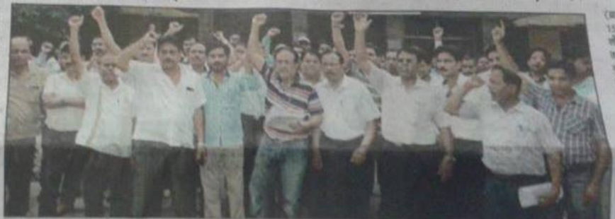
रेलने मुख्य कार्यिक कार्यालय पर प्रदर्शन कार्ते इंडियन रेलने टेकिनकल सुपरवाड़ तसे एसोसिएशन के सदस्य १

बाहर करने, रेसके सुरक्त करा को बंद करने, रेसके में उच्च प्रबंधकीय पदी कर परीक्ष प्रमेश करने तथा बाहरी एजेसी को किया जनकी विविध्यालाओं कर महान किये पान्यल होने को बात है। महानांत्री हंगोवियर रचेत पुन्यर पारित्र में करत कि इस रिपोर्ट को नाय अवसीकार करती है। असीने कामेरी को संस्कृतियों को स्वीकार व करते, रेशने को स्वर्गतानक सरस्य को साने देने को भार को। भारतिक कारकारण मंतरन के नंत्री इंजीरिन्द शंकन तक दुने ने निनेक देशरण करोती के अगरेदरी कियें गई सिद्धांती